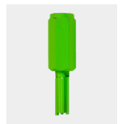
Vingerfrees (hardmetaal) Ø 10 mm