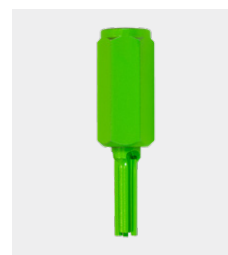
Vingerfrees (hardmetaal) Ø 8 mm