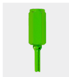
Vingerfrees (hardmetaal) Ø 6 mm