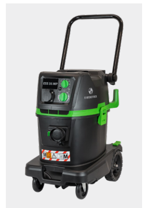
Industriestofzuiger ESS 35M IP